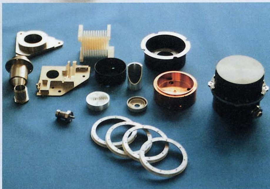
Schwierige Geometrien und teils exotische, weil weltraumtaugliche Materialien sind die Spezialität der Astro- und Feinwerktechnik Adlershof GmbH.

Damit alles noch einfacher geht, schließlich ist Weiler traditionell Lieferant von Maschinen für die Ausbildung, wird eine umfassende Ausbildung für die Werker angeboten. „Die Weiler unterstützt das Denken, Weiler unterstützt die Denker“, formuliert Manfred Schelling, denn: „Eine Maschine steht und fällt mit dem Bediener.“